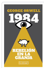
1984 / REBELION Col. LUCEMAR LUJO George Orwell