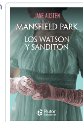
Mansfield Park - Los Watson y Sanditon Austen, Jane