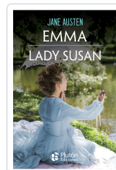
Emma y Lady Susan Austen, Jane