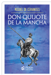
Don Quijote de la Mancha. Obras Cumbres de Cervantes, Miguel