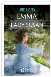
Emma y Lady Susan Austen, Jane