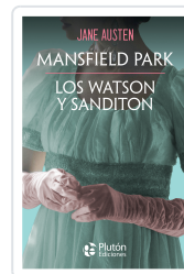
Mansfield Park - Los Watson y Sanditon Austen, Jane