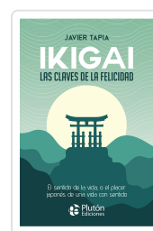
Ikigai: Las claves de la felicidad Javier Tapia