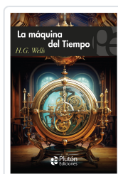
LA MAQUINA DEL TIEMPO Wells, H.G.