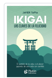
Ikigai: Las claves de la felicidad Javier Tapia