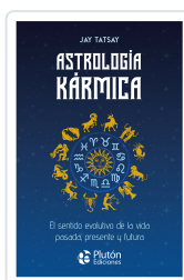
Astrología Kármica Tatzay, Jay