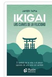
Ikigai: Las claves de la felicidad Javier Tapia