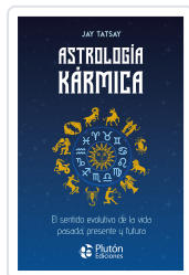
Astrología Kármica Tatsay, Jay