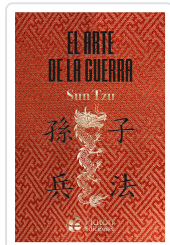
El arte de la guerra. AMATISTA Tzu, Sun