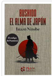
Bushido, el alma de Japón. AMATISTA Nitobe, Inazo