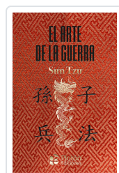
El arte de la guerra. AMATISTA Tzu, Sun