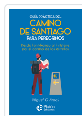
Guía práctica del camino de Santiago para peregrinos Aracil, Miguel G.