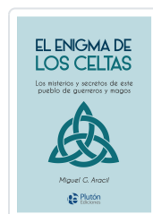
El enigma de los celtas Aracil, Miguel G.