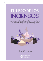
El libro de los inciensos Lavall, Barbié