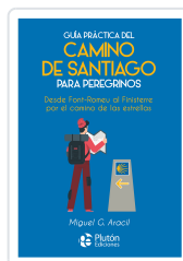
Guía práctica del camino de Santiago para peregrinos Aracil, Miguel G.