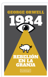
1984 / REBELION Col. LUCEMAR LUJO George Orwell