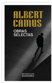
ALBERT CAMUS. Obras Selectas Albert Camus