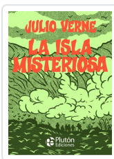
La isla misteriosa - PLATINO Verne, Julio