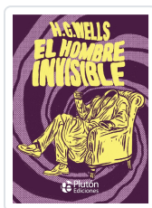
El hombre invisible - PLATINO Wells, H.G.