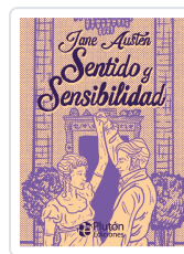
Sentido y Sensibilidad - PLATINO Austen, Jane