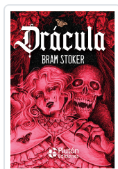
Drácula - PLATINO Stoker, Bram