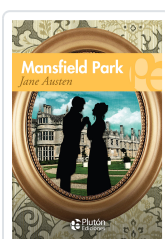
MANSFIELD PARK Austen, Jane