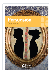
PERSUASION Austen, Jane